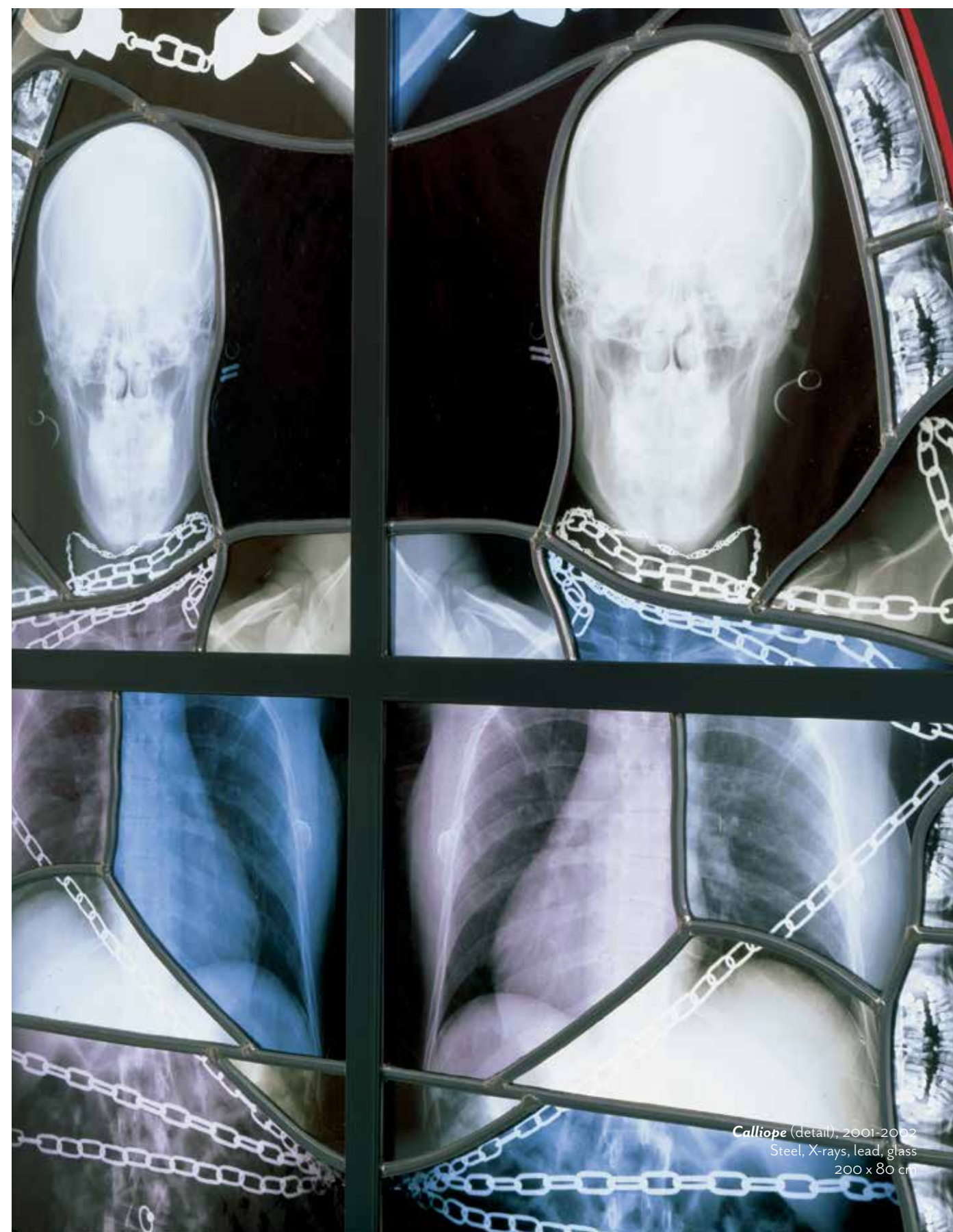
Calliope (detail), 2001-2002 Steel, X-rays, lead, glass 200 x 80 cm

Commandé à Michel Onfray à l'occasion de la création de la Chapelle (2006) de Wim Delvoye – œuvre installée de manière permanente au Mudam Luxembourg –, le texte « Vitraux in vitro et in vivo » a été publié pour la première fois dans le catalogue de l'exposition inaugurale du musée, Eldorado (Mudam éditions, 2006).