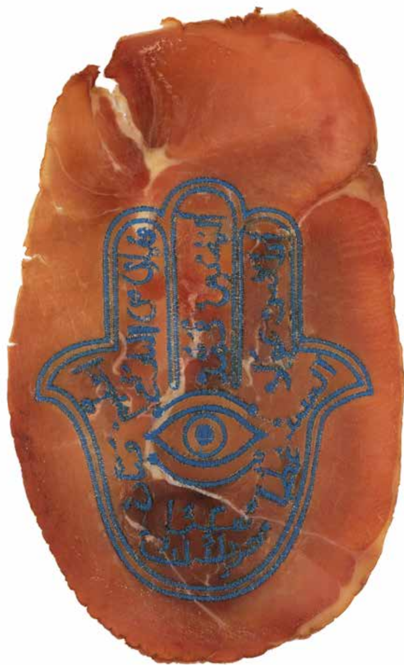
Embroidered Ham (Hand of Fatma) , 2003 Cibachrome print on aluminium 125 x 100 cm